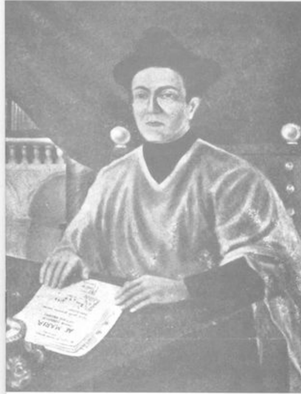
Tomás Luis de Victoria.

El disco número cinco contendrá cuatro obras del maestro abulense que suman 73 minutos de duración (Missa Ave maris stella, Nisi Dominus Quinti toni, Missa De beata virgine y Nativitas tua (antiphona) & Magnificat Primi toni), las mismas que el disco número seis, que reparte su música durante 72 minutos (Magnificat Quarti toni, Missa Gaudeamus Omnes, Magnificat Octavi toni y Salve regina (II)).